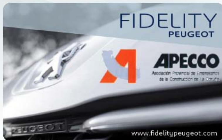
Tarjeta Personalizada Trato Preferente Apecco

A todo Asociado interesado en disfrutar de estas ventajas, se entregará una tarjeta personalizada para trato preferente, que deberá ser mostrada para la aplicación de las siguientes ventajas adicionales a las campañas promocionales vigentes en cada momento: